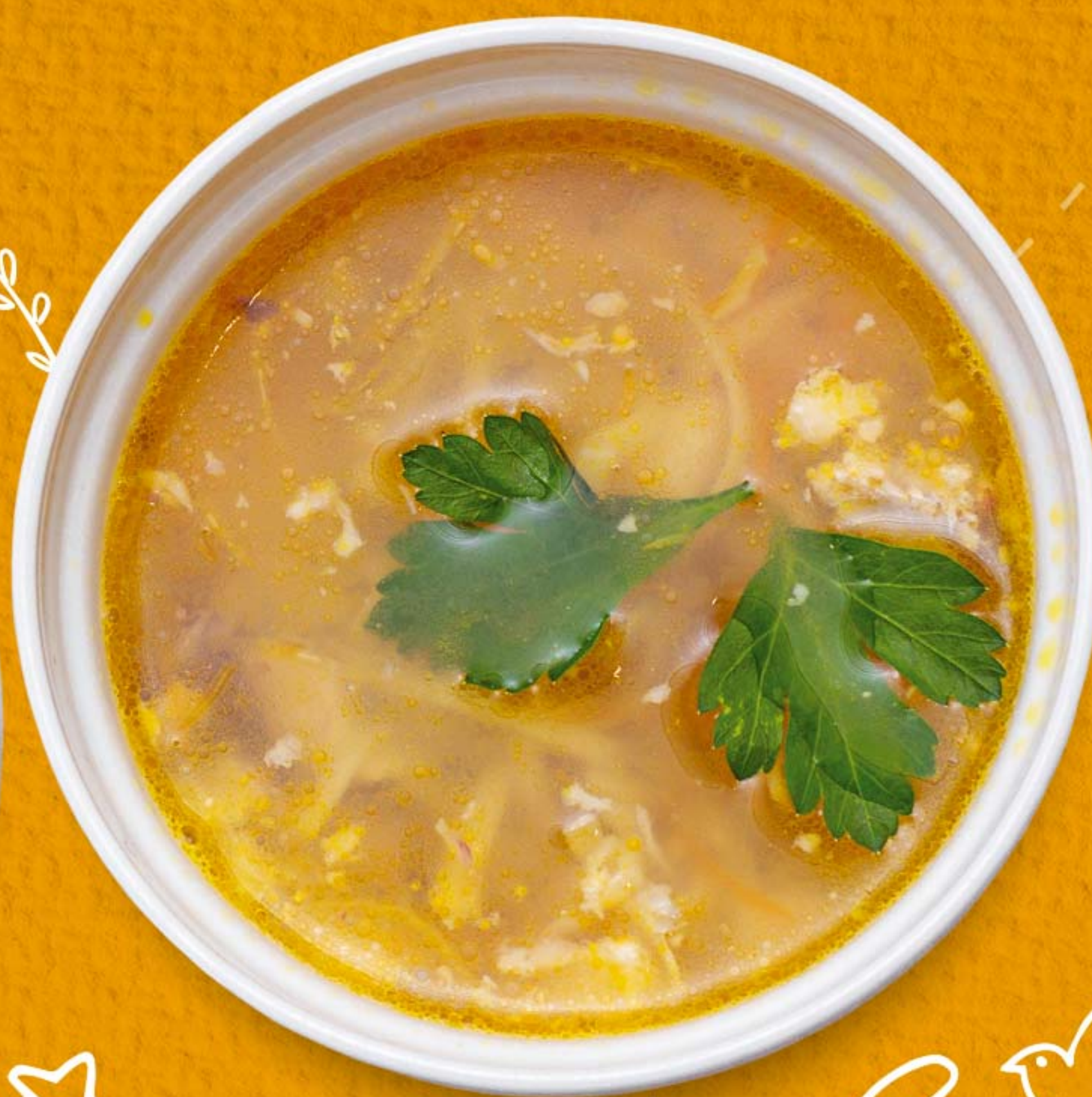
КУРИНЫЙ СУП-ЛАПША 230гр