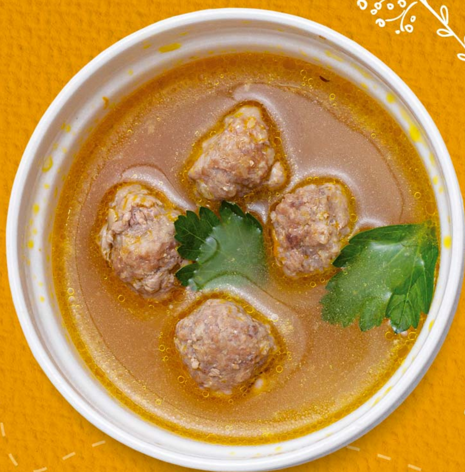
СУП С КУРИНЫМИ ФРИКАДЕЛЬКАМИ 230гр